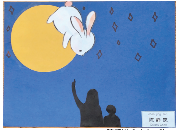
陳靜嵐 Osiphy Chen