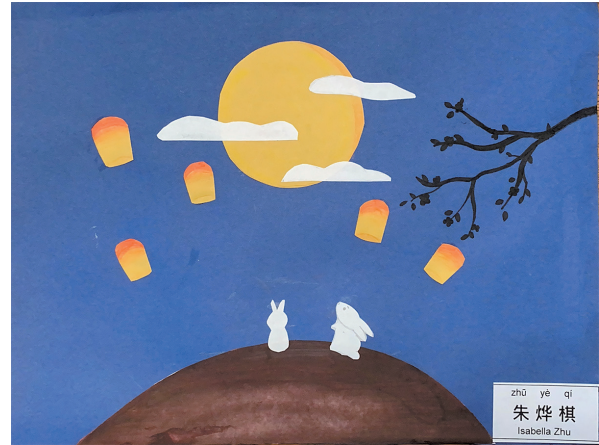
朱焯棋 Isabella Zhu